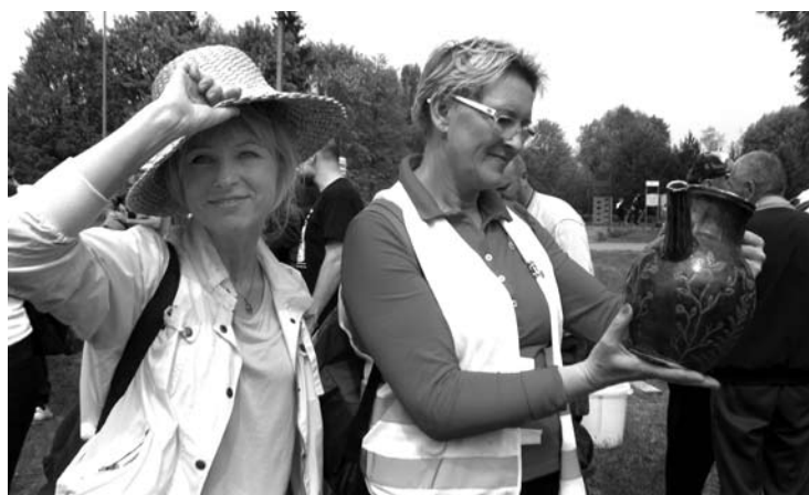
Ypatingai kulinariniu paveldu domėjosi moteriškės...

Stovyklavietėje Andrioniškio miestelio aikštėje keliautojai susipažino su lietuviškojo kulinarinio paveldo įdomybe - aukštaitiško salyklinio alaus gamyba. Demonstruotas salyklo salinimas, alaus tekimas per trikoję, supažindinta su apynių ir kitų priedų svarba ir, žinoma, ragautas alutis.