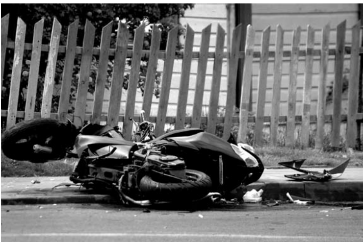
Avarijoje nukentėjo motorolerio vairuotojas.