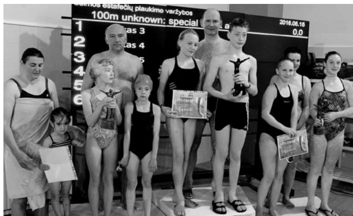
Ant nugalėtojų pakylas – Bernotų, Pupelių ir Lebedevų šeimos.

Kilių šeimoje buvo patys mažiausi plaukikai. Mėtai ir Adui atitinkamai tik dveji ir ketveri metukai, tad savo distanciją jie įveikė padėdami tėvelių.