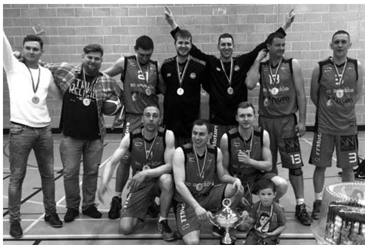
Praeitų metų Britanijos lietuvių krepšinio lygos (BLKL) čempionai „Anykščiai BC“ šiemet laimėjo kitą trofėjų - A. Sabonio taurę.

Po nelabai sėkmingai susiklosčiusio sezono praeitų metų Britanijos lietuvių krepšinio lygos (BLKL) čempionai „Anykščiai BC“ atsigriebė taurės varžybose. Užpraėjusį savaitgalį Londone Didžiąją taurę iškovojo „Anykščių BC“ kolektyvas, finale įveikęs favoritais laikytus „Baltic Staff“ krepšininkus.